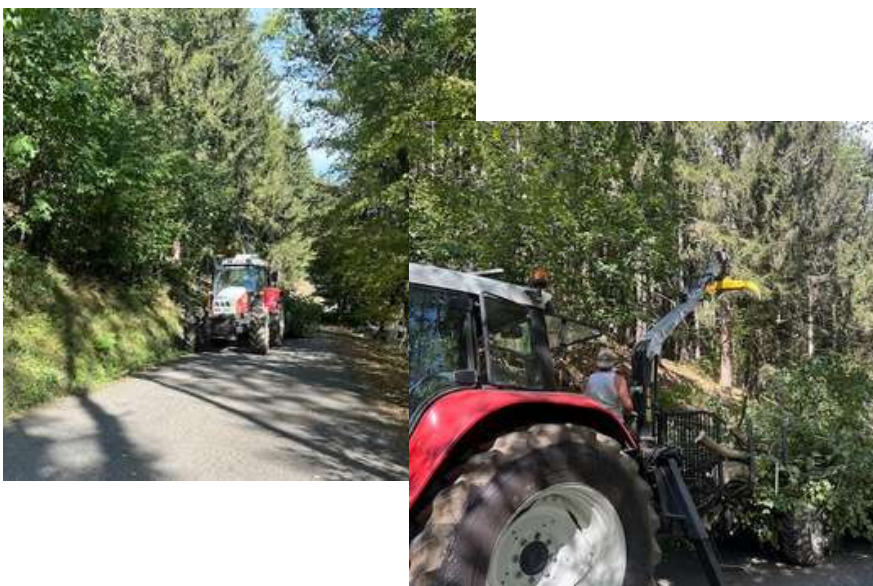
Coupe préventive par la ferme auberge de la Glashütte